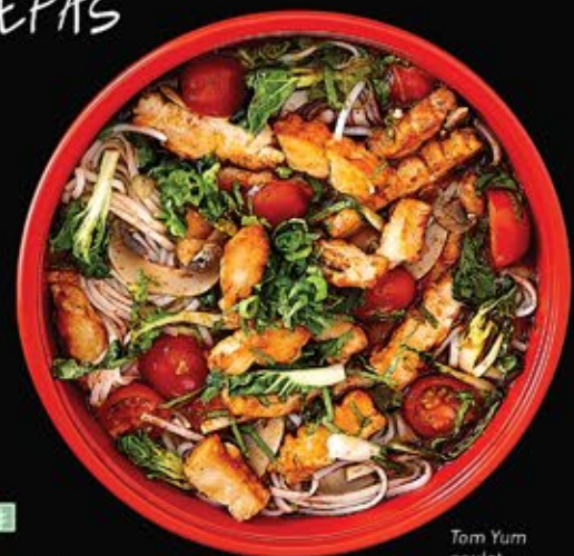
Tom Yum poulet